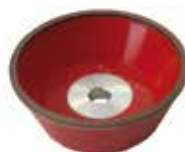
Mola diamantata: Diamond grinding wheel: алмазный шлифкруг: D107 D46 D15