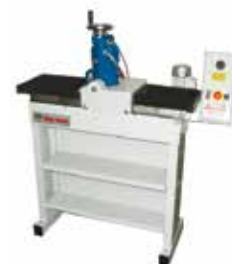
Soffietti di protezione Rubber protection bellows защитные меха