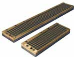
Piano magnetico a campo aperto per metallo duro: Open field high power magnetic chuck for carbide inserts: магнитная плита для твёрдых сплавов: 400x70x20 200x70x20

A richiesta: / Upon request: / По запросу :