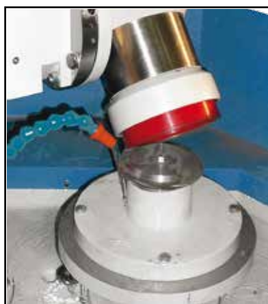
Flangia per tavola rotante Flange for standard rotating table Flansch für Standard-Drehtisch