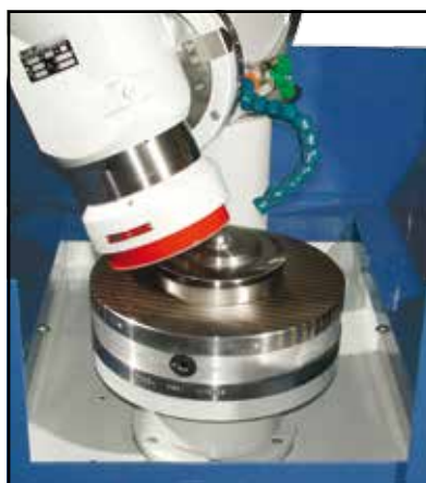
Flangia per piano magnetico Flange for magnetic table Flansch für Magnettisch