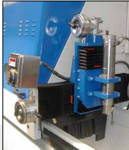
Rilevatore di livello RTS