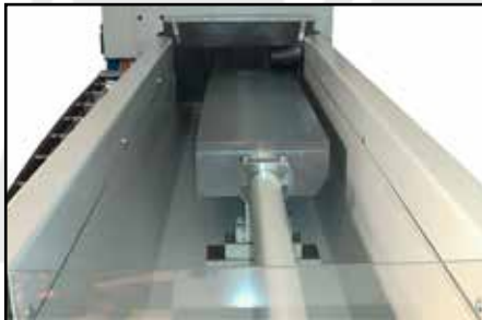
Schwenkbar Magnettisch (Breite 200-250-300-350 mm)