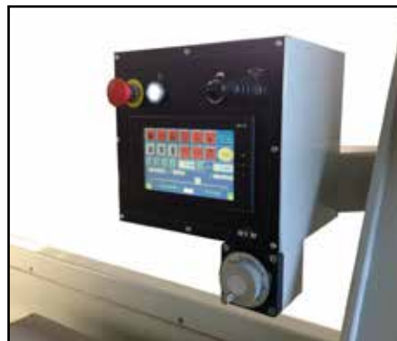
PLC con display touch screen e volantino elettronico