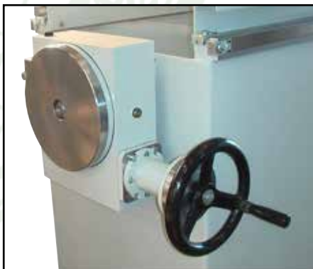
Nonius-Teilapparat für Magnettisch-Drehung \pm 90^\circ