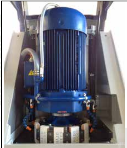
Segment Schleifscheibe (Ø400-450 mm)